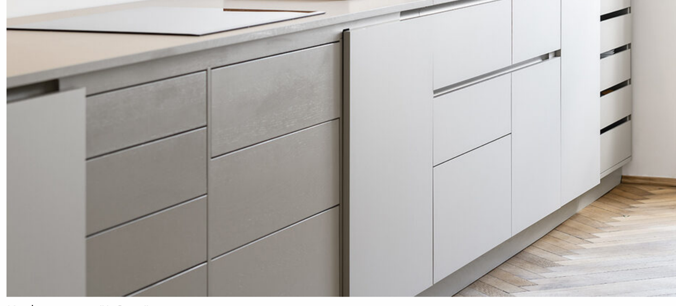
Küchensystem "J.Gast"

Der neue Leica Store, den sie in Zusammenarbeit mit Office Heinzelmann Ayadi (OHA) entworfen haben, wurde beispielsweise Ende 2020 in München eröffnet und schafft mit natürlichen Oberflächen eine angenehme Atmosphäre, in der man sich gerne aufhält. Die Unterbauten der Vitrinen sowie die Einbauten aus nachhaltigem Holz bieten eine angenehme Haptik und überlassen den Produkten die Bühne. Das Pendant wird gerade in Tokio entwickelt, von Holzrausch entworfen und ganz im Sinne der Nachhaltigkeit von den lokalen HandwerkerInnen produziert. Gemeinsam mit Grünecker Reichelt Architekten haben sie zudem das "Turmhaus Tirol" erdacht, das sich an der regionalen Bauart orientiert, charakteristische Merkmale der umliegenden Höfe aufgreift und neu interpretiert. Aktuell entwirft Holzrausch zudem gemeinsam mit befreundeten DesignerInnen eigene Produkte, "quasi Projekte im Projekt, von der Beleuchtung bis zum Möbel", so Petzold. "In dem Moment, in dem eine Aufgabe einen ganzheitlichen Ansatz hat, wird es interessant für uns", resümiert er.