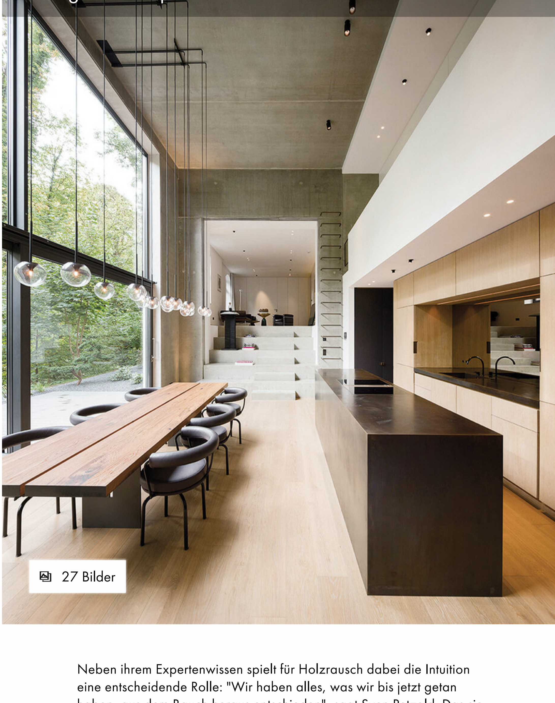
Bildergalerie Projekte Holzrausch